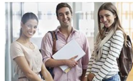
İstehsalat praktikası proqramı