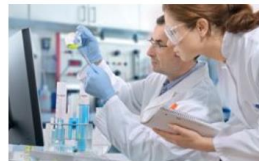
Texniklər üçün ixtisasartırma