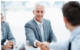
Təcrübəli peşəkar kadrlar

Nəzərə alın ki, burada göstərilən möhletlər təqribi xarakter daşıyır. Belə ki, daxil olan ərizələrin həcminin böyük olması işəgötürmə prosesinin bir qədər çox davam etməsinə gətirib çıxara bilər. Nə «SOCAR Polymer»in özü, nə də bizim adımızdan işə götürməklə məşğul olan istənilən digər təşkilat ərizələrin qəbulu və işlənməsi prosesində ərizə verən şəxslərdən heç bir nağd pul və ya digər ödəniş tələb edə bilməz. Bizdən birbaşa və ya dolaylı iş təklifi alan istənilən şəxs işəgötürmə prosesini tam olaraq keçməlidir.